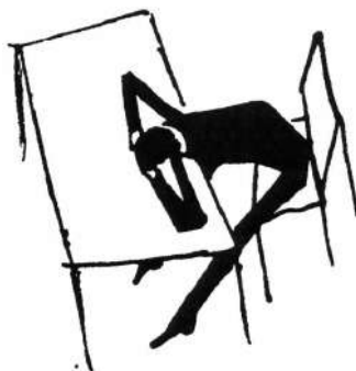
dessin de Franz Kafka

La rencontre de l'écrivain et de la petite fille est vraie : elle est mentionnée par Dora Diamant, l'amoureuse de Franz Kafka, dans ses mémoires. Les aventures de la poupée sont évidemment inventées. C'est le fruit de l'imagination de l'écrivain. Ce dernier utilise la fiction pour voler au secours du chagrin de la petite fille et lui faire oublier sa peine, faire le deuil de la perte de l'objet aimé, la poupée disparue. Ce n'est donc pas vrai, c'est inventé. Est-ce pour autant un mensonge ? C'est l'occasion d'aborder une petite discussion philosophique sur mentir et inventer.